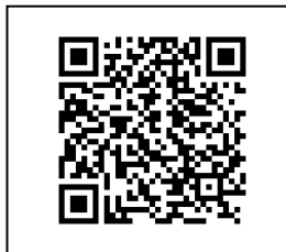
QR Code ระบบรับสมัคร

๓. หน่วยงานแจ้งผู้ผ่านการคัดเลือก กรอกข้อมูล พร้อมแนบเอกสาร ในระบบสมัครออนไลน์ของ ศอ.บต. ที่ https://zhort.link/tO๔ ที่ปรากฏด้านล่าง ภายในวันที่ ๒๘ มกราคม ๒๕๖๕ เวลา ๑๖.๓๐ น.